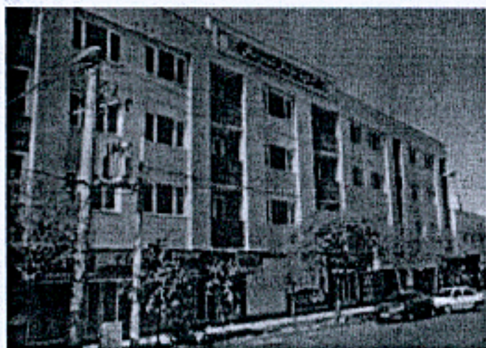
بنیاد دانشگاهی فردوسی